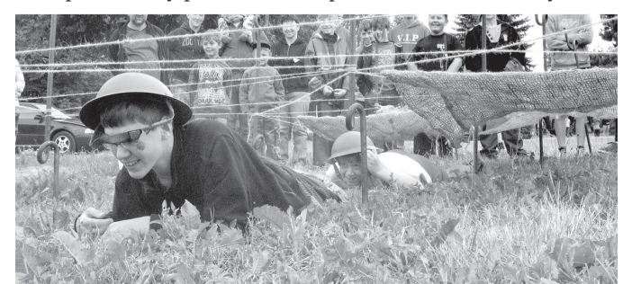
„Zatracenej blembák!“ Jak se v tom má člověk plížit? V tom že bojovali?

pro padesát lidí. Zájem byl však takový, že bylo třeba promítání o dvě hodiny později opakovat. V neřízené diskuzi, která se po zhlédnutí filmu rozproudila, jsme se dozvěděli, že na pod- zim čeká obec další zajímavá událost. Ve vypálených Lidicích kdysi jako zázrakem obrazil jeden stromek - hruška. Tato hruška se stala symbolem nadě- je a nyní se připravuje darování stromků naroubovaných touto lidickou hruškou několika ob- cím, které spojuje tragická his- torie. Dolní Vilémovice jsou jed- nou z těchto obcí. Symbolicky tak bude potvrzeno, že obě obce patří k sobě i přesto, co se událo před dvaasedmdesáti léty.