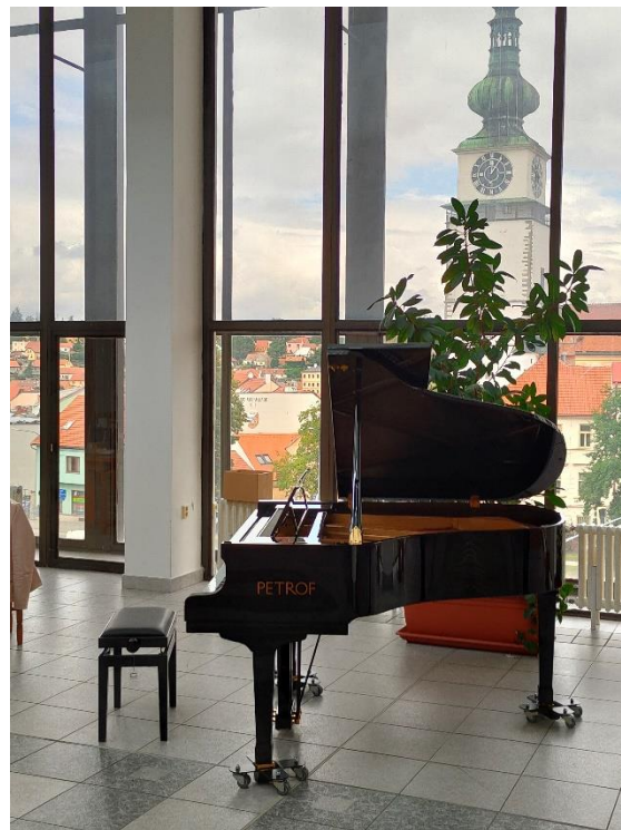
Nový klavír Petrof